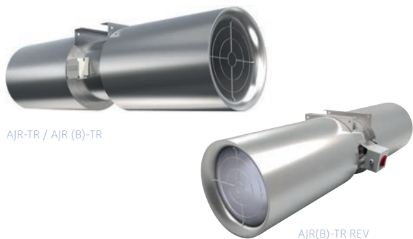
AJR-TR / AJR (B)-TR