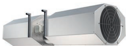
AJ8-TR / AJ8(B)-TR